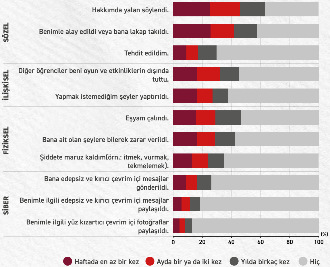
Grafik 2. 4. sınıf öğrencileri arasındaki akran zorbalığı türleri ve maruz kalma sıklıkları